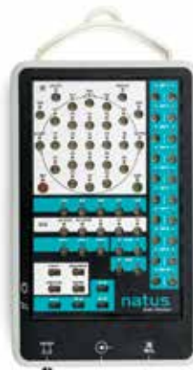
Natus Brain Monitor*

Amplificateur versatile qui offre différentes options de test