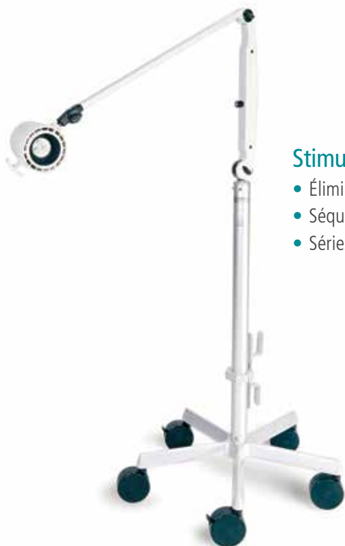
Stimulateur photique à DEL Natus

*nécessite NeuroWorks version 9.0 ou ultérieure